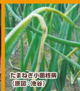
たまねぎ小黒核病 (原図:池谷)