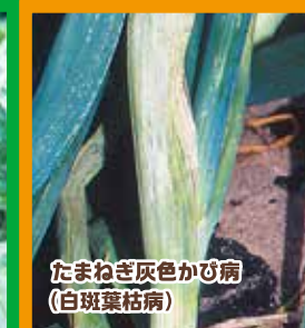
たまねぎ灰色かび病 (白斑葉枯病)